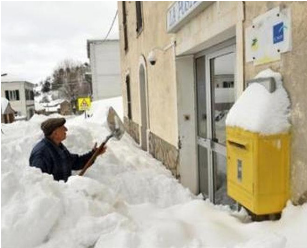
Poste gelé (allégorie)