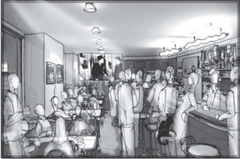
Courts métrages - Bar Le refuge - 22 rue des Sœurs Macarons -

Le Comité de Soutien à l'équipe de prévention spécialisée Vivre dans la Ville de Vandoeuvre avec le soutien des syndicats CGT et Solidaires appelle à un rassemblement lundi 25 novembre à 18h45 à la Mairie de Vandoeuvre.