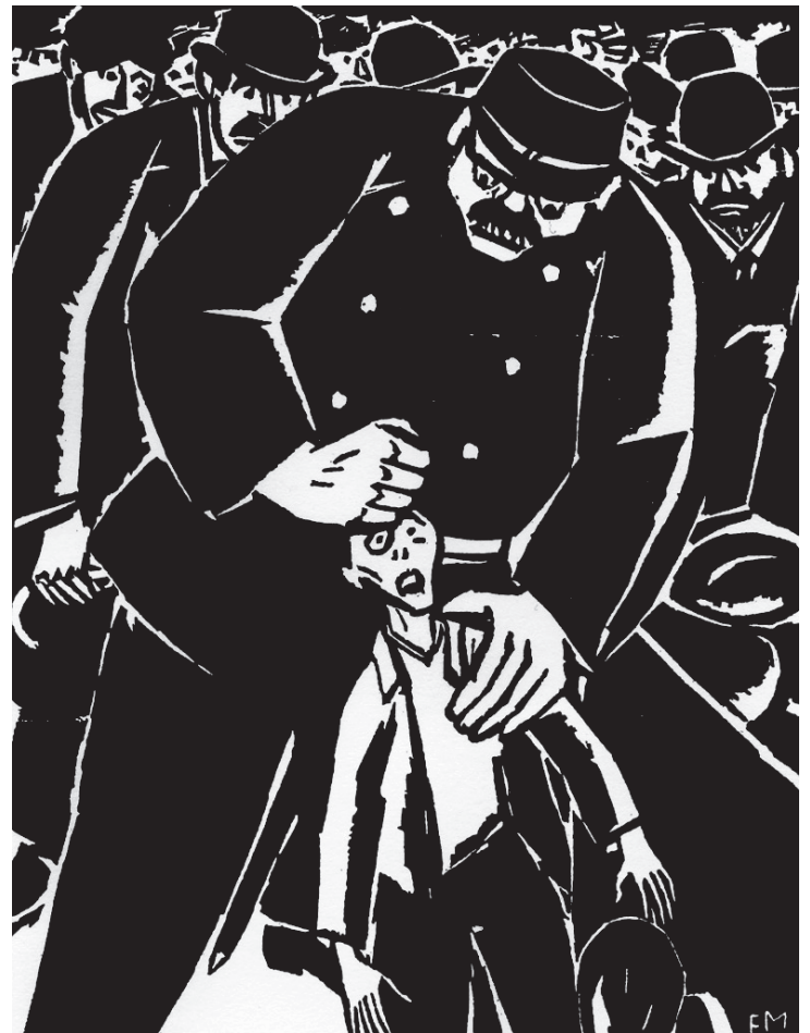
Frans Masereel, 1918.